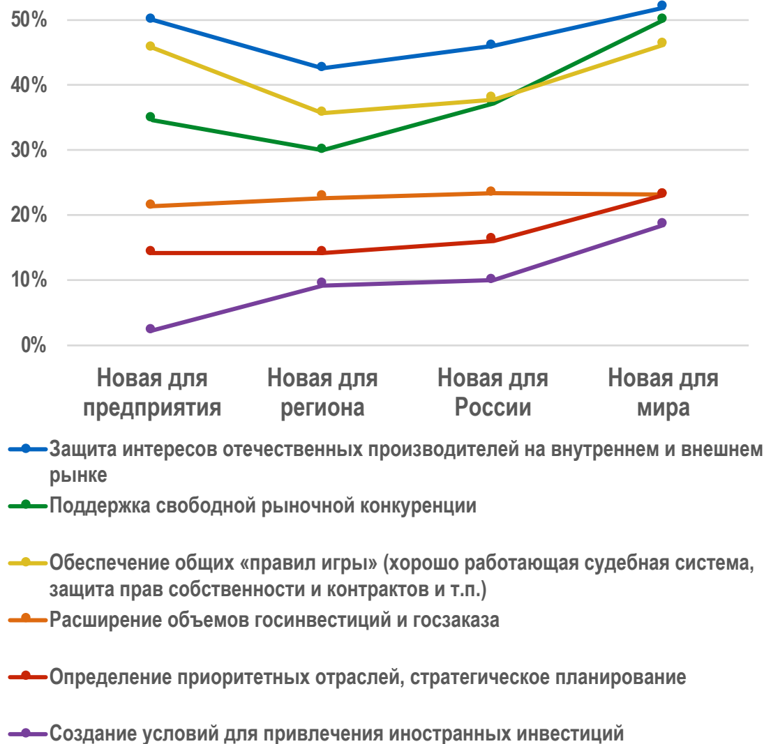
Важнейшие функции государства, % отметивших от числа предприятий